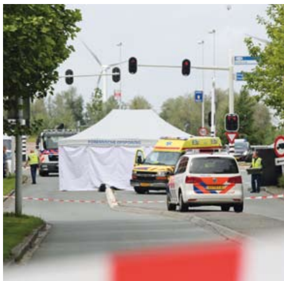
Zaterdag 29 juni, weer een liquidatie in Amsterdam-West

2013 tot nu toe gekenmerkt door veel meer moorden dan vorige jaren. Vooral liquidaties maken een einde aan jarenlange daling